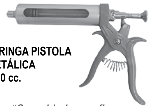
JERINGA PISTOLA METÁLICA x 50 cc.

Comunera de Santander, donde las tierras están bendecidas, pese a la sequía, con fuentes hídricas por las que aún corre el agua.